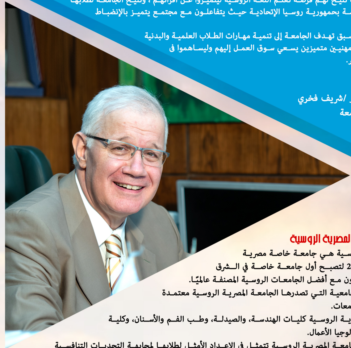
الأستاذ الدكتور / شريف فخري رئيس الجامعة

ومن خلال جميع ما سبق تهدف الجامعة إلى تنمية مهارات الطلاب العلمية والبدنية والاجتماعية ليتخرجوا مهنيين متميزين يسعى سوق العمل إليهم وليساهموا في تقدم وطننا الحبيب مصر.